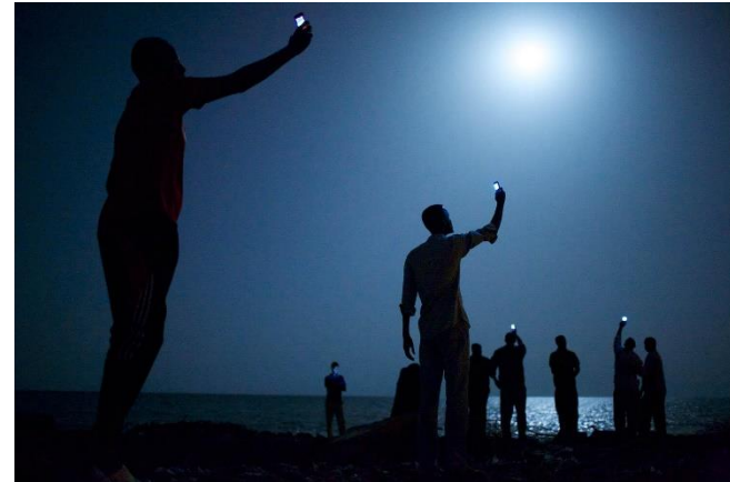
Abb. 6: Signal (Stanmeyer, 2014)

Stanmeyer zeigt in seinem Foto Migranten an der Küste von Djibouti (siehe Abbildung 6).